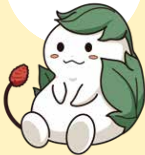
くわまる