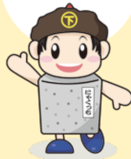
にやくっち