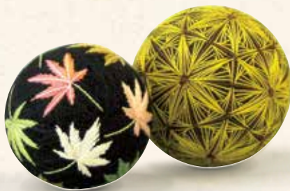
色変わりもみじと渦いちよう