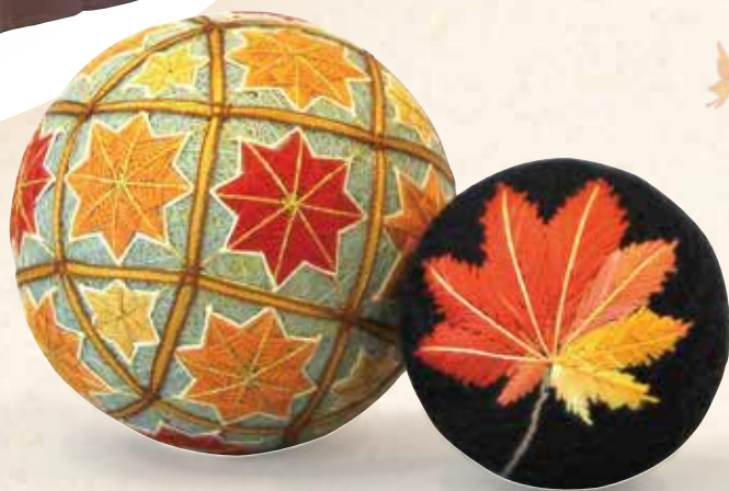
紅葉ともみじー葉