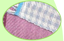
まいそうこう 4枚綜織 (綾織り) (千鳥格子の模様 ができます)