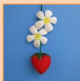
3月 花いちごストラップ (材料費350円)