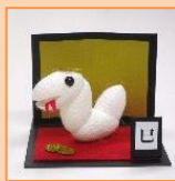
1月 干支ヘビ (材料費500円)