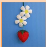
3月 花いちごストラップ (材料費 350 円)