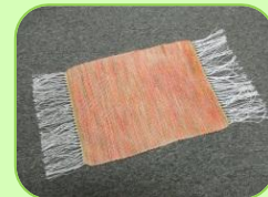
ランチョンマット (平織り / 4枚綜織)