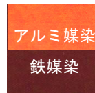
アルミ媒染 鉄媒染