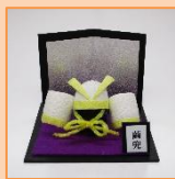
4月 繭兜 (材料費 500 円)