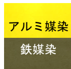
アルミ媒染 鉄媒染