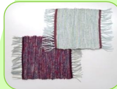
コースター (平織り / 4枚綜織)