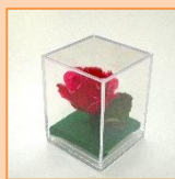
5月 バラキューブ (材料費 500 円)